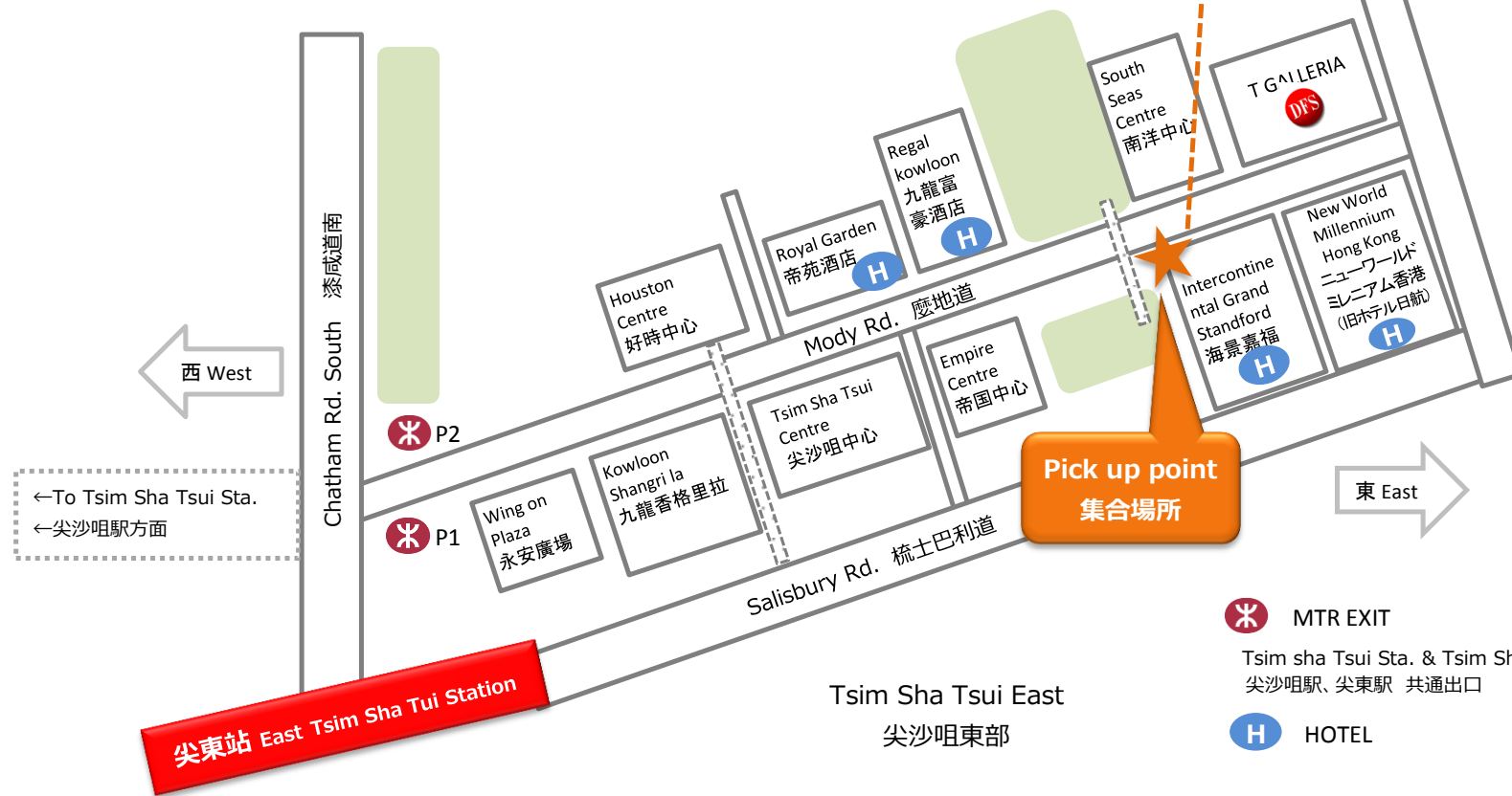
Tsim Sha Tsui East 尖沙咀東部